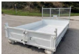
FOND DE BENNE EN TÔLE ALUMINIUM EN 2 PARTIES AVEC RENFORT CENTRAL