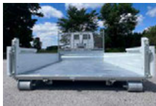
FOND DE BENNE EN TÔLE ACIER EN 2 PARTIES AVEC RENFORT CENTRAL