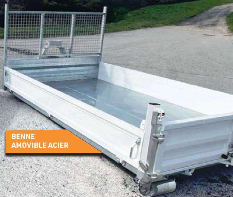
BENNE AMOVIBLE ACIER