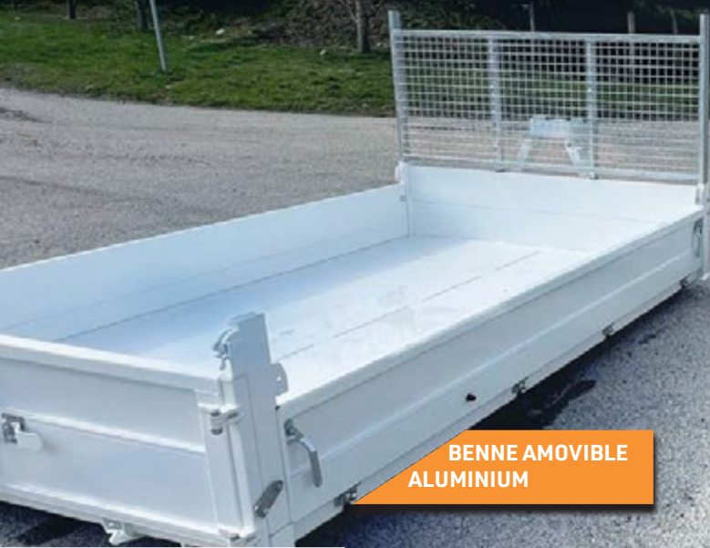
BENNE AMOVIBLE ALUMINIUM