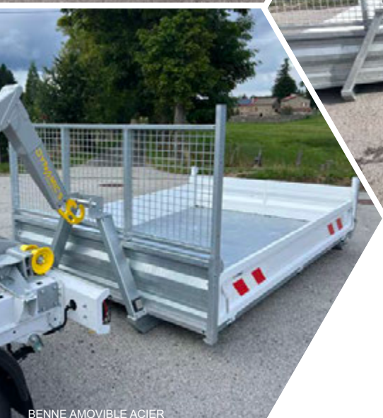
BENNE AMOVIBLE ACIER

BENNES AMOVIBLES DYNAMAC'S REMOVABLE TIPPER