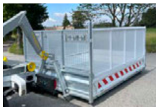
BENNE AMOVIBLE ACIER AVEC RÉHAUSSES GRILLAGÉES