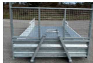
FACE AVANT GALVANISÉE