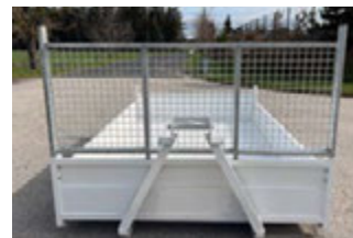
FACE AVANT ALUMINIUM ET PORTE ÉCHELLE GALVANISÉE