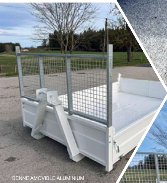
BENNE AMOVIBLE ALUMINIUM