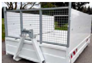
BENNE AMOVIBLE ALUMINIUM AVEC RÉHAUSSES PLEINES